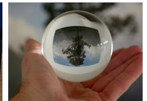
Perspektivwechsel eröffnen neue Handlungsspielräume