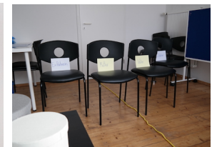
Trennung von Paar- und Elternebene