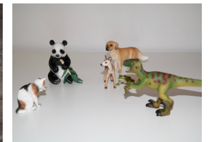
Arbeit mit Metaphern: Team-Aufstellung mit Tieren