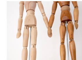
Ein wichtiges Thema: Stärkung der Paarbeziehung

Das Leben als Paar oder Familie durchläuft verschiedene Phasen und wird mit plötzlichen Veränderungen konfrontiert. Jede Form des Umbruchs stellt hohe Anforderungen an die Fähigkeiten der Menschen, mit den neuen Gegebenheiten zurecht zu kommen. Wenn die bisherigen Bewältigungsstrategien nicht greifen, kann Systemische Paar- oder Familientherapie Sie dabei unterstützen, Probleme zu lösen und Herausforderungen zu meistern.