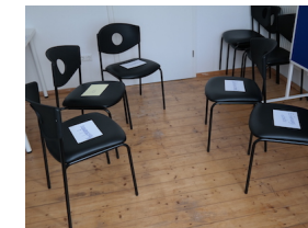
Externalisierung innerer Anteile mittels Stuhlskulptur

Im Spannungsfeld von Individualität und Gemeinschaft sieht sich der Mensch nicht selten mit persönlichen Krisen konfrontiert. Deren Ursache liegt häufig in emotionalen Verstrickungen oder hinderlichen Lebensregeln und Bewertungen. Systemische Beratung oder Therapie können Ihnen dabei helfen, solche Krisen durch Vergegenwärtigung Ihrer Ressourcen, Perspektivwechsel und damit einhergehende Umbewertungen zu bewältigen.